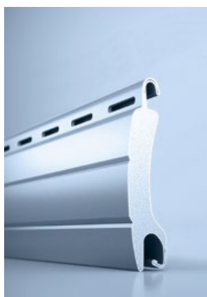
1 heroal RS 32