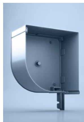
1 heroal FMB 45°