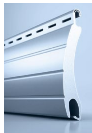
4 heroal RS 55 SL