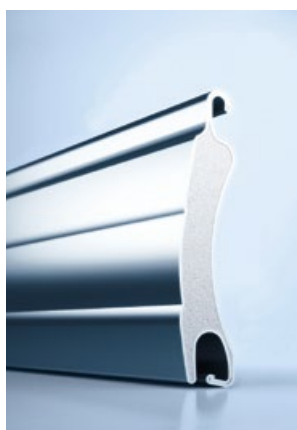
2 heroal RS 37 RC 3