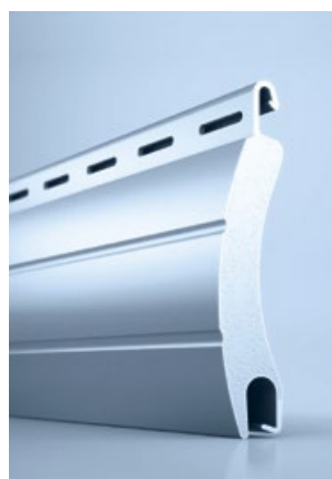
3 heroal RS 42